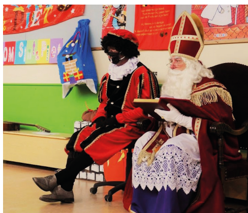
Sinterklaas op school 3 december 2021