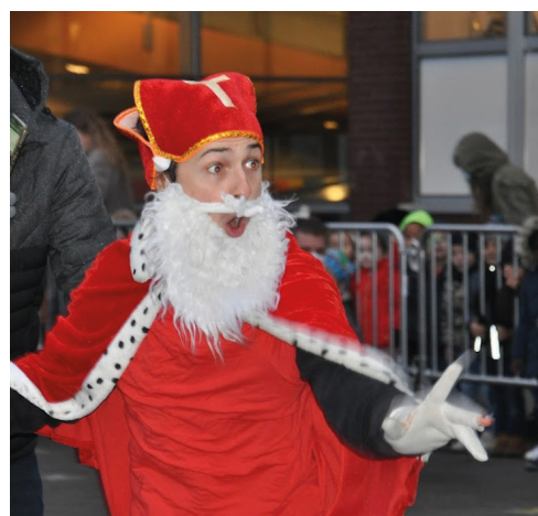
Sinterklaas op school 3 december 2021