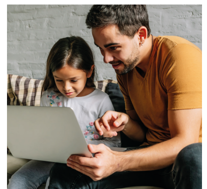
Digitaal mee met je kadee 13 januari 2022