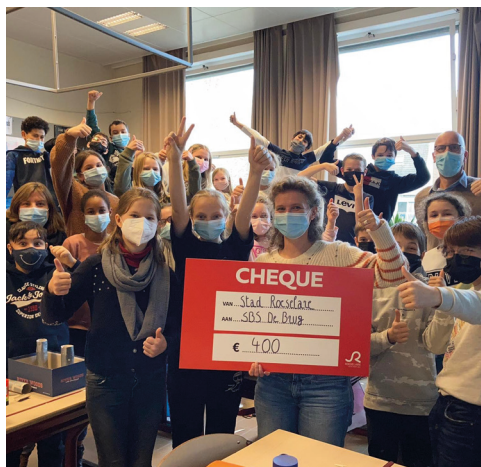
rode neuzen dag zaterdag 27 november 2021

Een definitie die perfect aansluit bij de Rots en Waterlessen, onze school werd genomineerd en beloond, we mochten een cheque van 400 euro ontvangen.