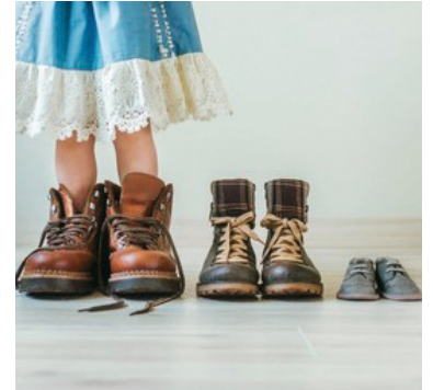
School in zicht

Graag vooraf inschrijven via www.schoolinzicht.be